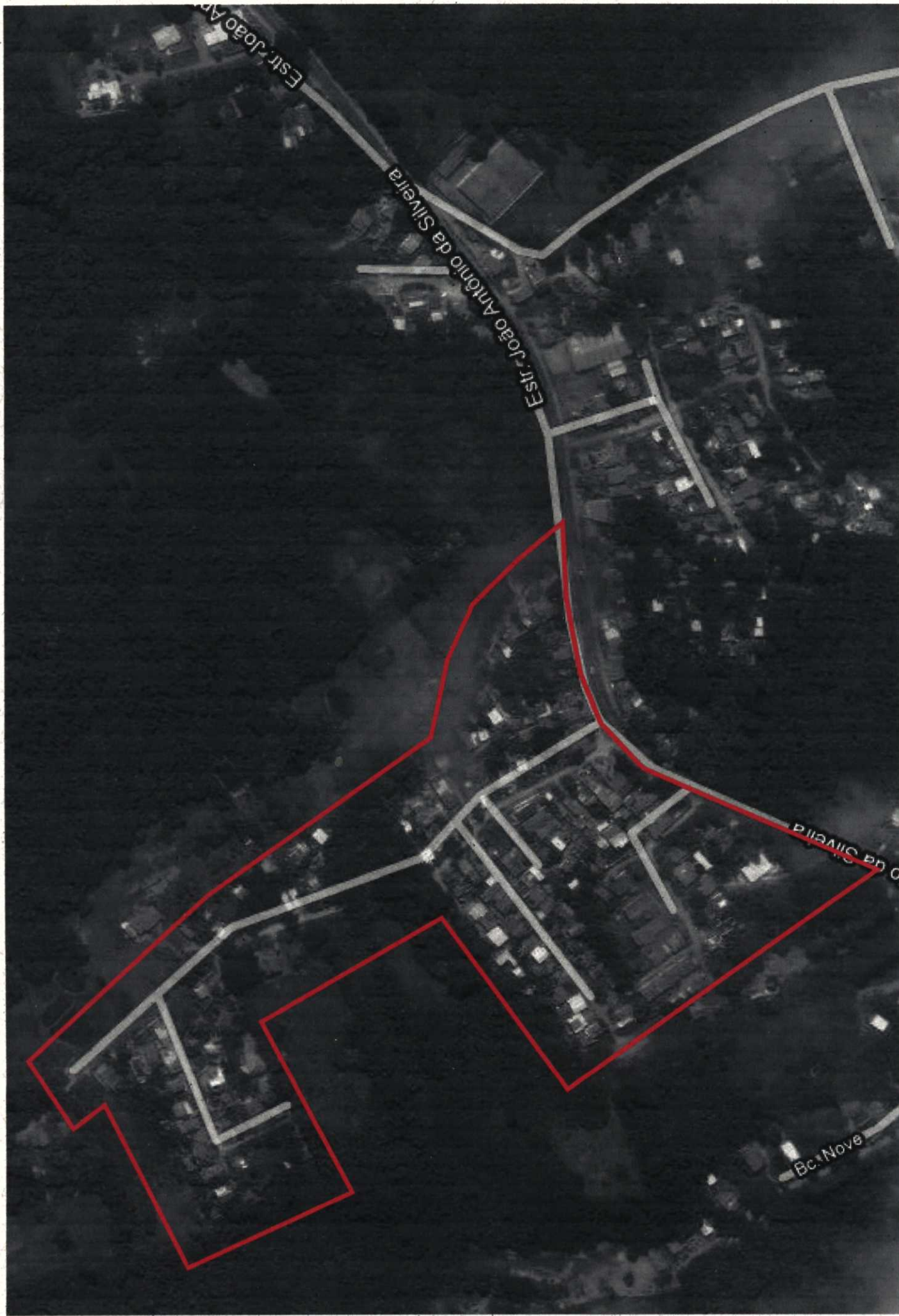
Lot. Dona Francisca