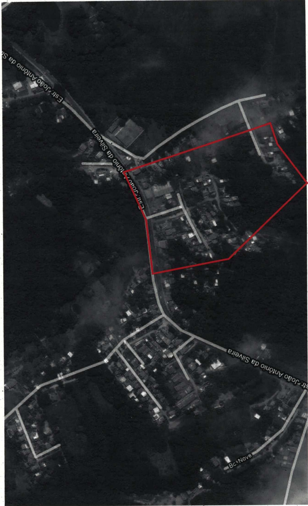
Portal da Figueira